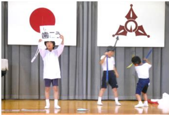
のむきちょうぶんかさい はっぴょう げき ～野向町文化祭でも発表した劇～ おいらの名前はミュータンス！

6月の歯の衛生週間に元気委員会が“むし歯の原因を楽しく学べる劇”を発表しました。その後、歯科検診で“むし歯0”だった子と、今年度の“歯みがき名人”にメダルをかけました。子どもたちのアイデアで取り組んだ委員会活動が認められ、この賞をいただきました。 元気委員会のみなさん、よくがんばりました。これからも、自分たちの手で学校を良くしよう！