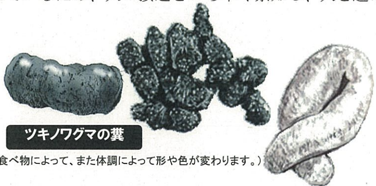
ツキノワグマの糞

雨や風の音、霧などにより、クマも人の気配に気づかず至近距離まで接近することがあります。